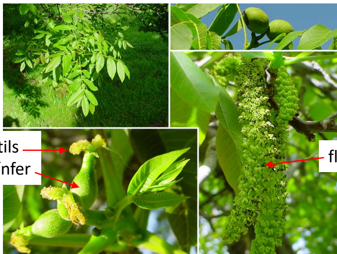
2 estils → ovari ífer →

7a. Ovari ífer; 2 estils; drupa de 4-5 cm (la nou); arbre alt, amb els folíols d'uns 6-15 cm; flors ♂ en ament