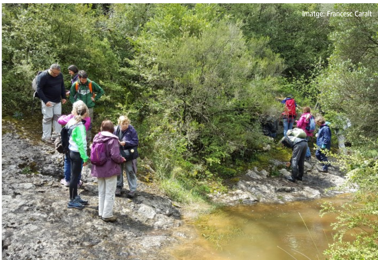
Imatge: Francesc Caralt

Per a acomplir aquests reptes s'ha dissenyat una nova estructura organitzativa que es basa principalment en la repartició de tasques entre quatre vocalies: botànica, etnobotànica, història de la botànica i informàtica. Cadascuna té assignada una sèrie de fites per a aquesta legislatura (2017-2022).