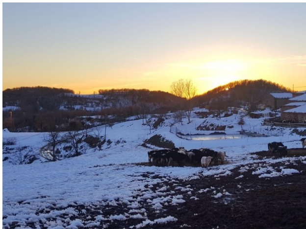
Posta de sol després de la nevada.

El taller del diumenge 17 de gener va tractar de la flor. La lliçó va ser molt profitosa i els conceptes es van presentar de manera clara i entenedora. Després de les explicacions es va organitzar un concurs