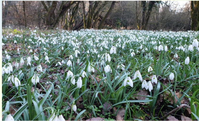
Florida meravellosa del liri de neu ( Galanthus nivalis ).

A principis de 2016, el Grup Local del Moianès va començar a fer sortides botàniques amb una certa regularitat. La comunicació dels membres del grup es feia a través de l'aplicació WhatsApp per concretar el dia i l'hora de cada sortida.