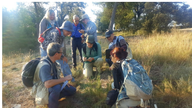
Sortides del Grup.

Les sortides botàniques es fan principalment per la rodalia de Castellterçol i altres pobles veïns. Tot i que alguns residents permanents del poble han participat esporàdicament en alguna activitat del grup, cap ho ha fet amb regularitat. Els membres del grup que col·laboren de manera més continuada en totes les activitats són persones que tenen la segona residència a Castellterçol o que viuen en altres pobles, més o menys llunyans, i que es desplacen per assistir a les trobades.