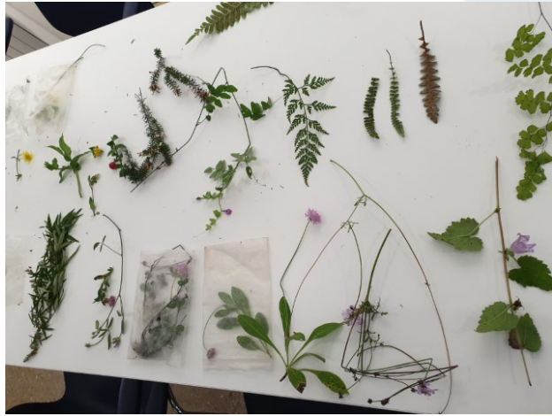
Taller d'identificació de plantes.

A la tardor de 2017 vam començar a organitzar les sortides regularment cada tres diumenges. La Carme Portet ens va animar a fer tallers presencials. És per això que avui dia s'alternen sortides de tot un matí amb unes altres de més curtes, que es completen amb un taller d'estudi i de determinació de les plantes trobades mentre passegem.