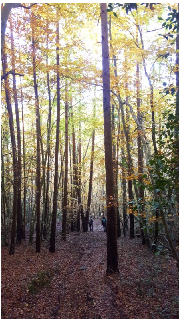
La fageda de la Sauva Negra.

El Solà del Sot és una masia de Granera a la qual s'arriba bé fent una passejada des de Castellterçol. El camí de la vall té només alguns pendents forts, en general són relativament suaus i convida a la passejada. La font i la bassa ofereixen una vegetació singular.