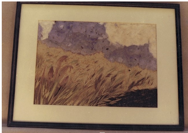
Quadre i llums fets amb composicions de plantes.