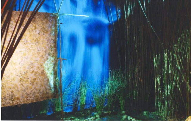
Dones d'aigua.