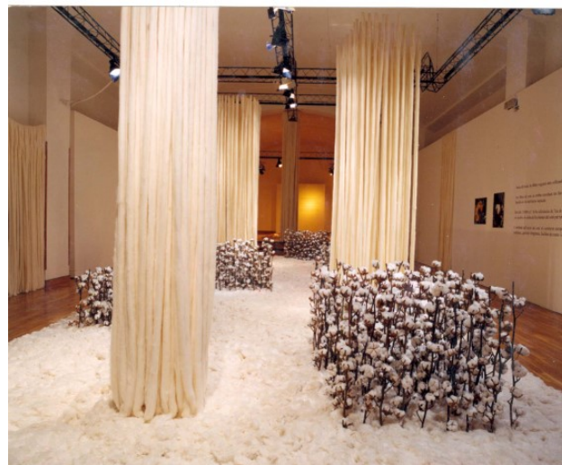
El teixit del món .