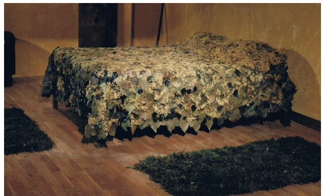
Vànova de saüc.

Actualment explico els usos de les plantes a través de tallers, on mostrem in situ on creixen. És