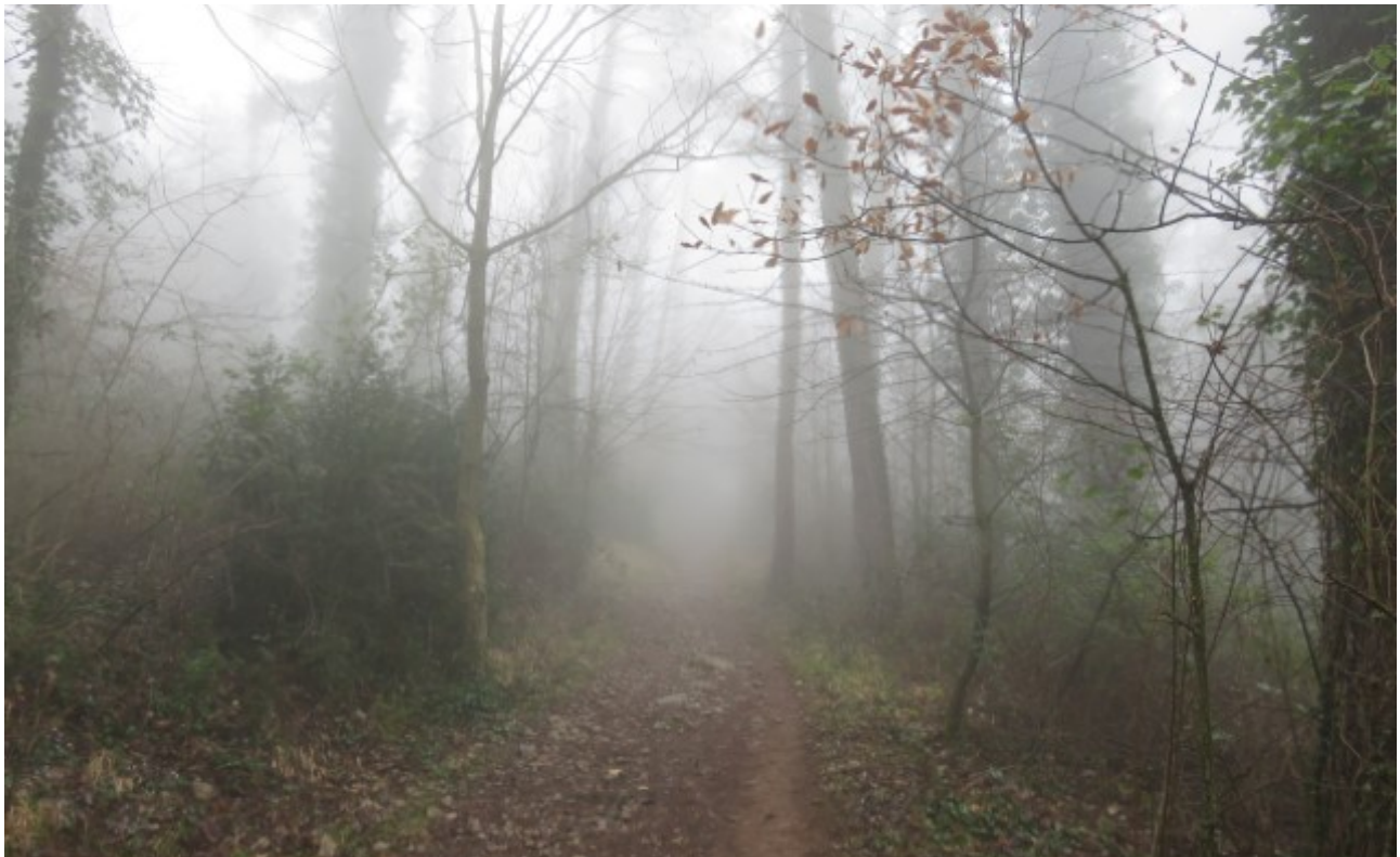
Obaga de Queralt.

A continuació trobem un camí més ample que, cap a l'esquerra, ens porta de nou fins a la carretera del santuari. La travessem i passem pel costat de la capella de la Sagrada Família. De seguida tornem a travessar la carretera i seguim el camí que s'endinsa cap a l'interior de la pineda. Aquí hi podem trobar: pi roig ( Pinus sylvestris ), til·ler ( Tilia platyphyllos ), avellaner ( Corylus avellana ), blada ( Acer opalus , Acer pseudoplatanus ), algun roure ( Quercus pubescens ), boix ( Buxus sempervirens ), sanguinyol ( Cornus sanguinea ) i tortellatge ( Viburnum lantana ).