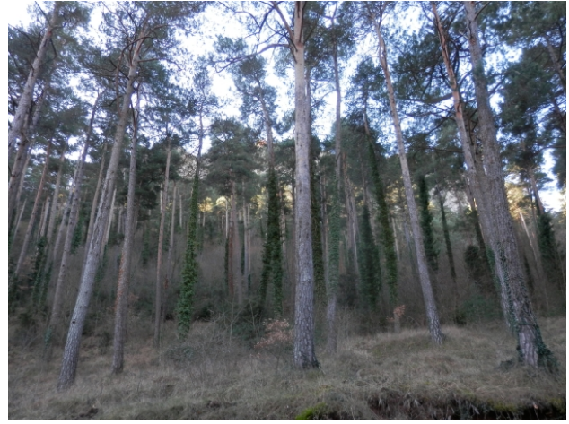
Pineda de l'obaga de Queralt.

apareixen aviat a l'esquerra els primers contraforts rocosos de la serra, on podem apreciar algunes plantes com l'albó ( Asphodelus cerasiferus ), l'hieraci ( Hieracium sp.) o altres espècies rupícoles.