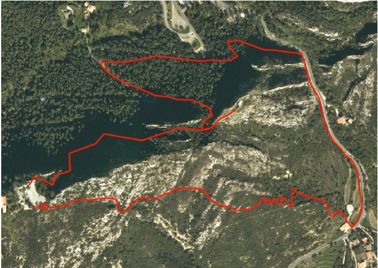
Recorregut de l'itinerari a la serra de Queralt.

L'itinerari discorre per la serra de Queralt, localitzada a la franja de contacte entre la depressió Central i la serralada dels Pirineus. La serra s'aixeca imponent just a sobre de la ciutat de Berga, en el límit entre el Baix i l'Alt Berguedà. Botànicament és, doncs, terra de frontera entre la mediterraneïtat i l'ambient muntanyenc. Aquest caràcter queda es-