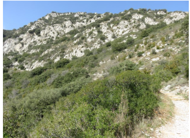
Solell de Queralt, Fotografia: Carles Espelt.

Quan tornem a trobar la carretera, la seguim uns quants metres cap a l'esquerra en direcció a Sant Pere de Madrona (en aquest punt hem deixat el camí principal de l'obaga de Queralt). En arribar al revolt, deixem la carretera i seguim un camí ample a la nostra esquerra, que ens pujarà fent esses, amb reposadors en cada revolt, fins al replà sota l'església de Sant Pere de Madrona.