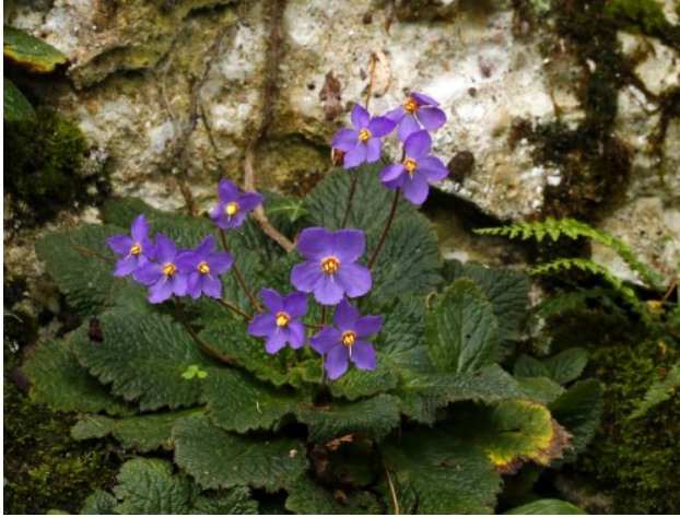
Orella d'os ( Ramonda myconi ).