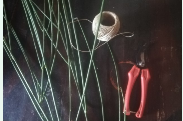
1. Materials necessaris: tisores, fil de cànem i tiges de ginesta.

Per a tenir la ginesta preparada per a poder treballar-la, primer l'haurèm d'haver collit, preferiblement a finals de juliol o agost. La deixarem assecar al sol si la volem blanquejada o a l'ombra si la preferim verda. Quan la tinguem ben seca, la posarem tota la nit en remull perquè les fibres recuperin la flexibilitat i les puguem doblegar sense que es trenquin.