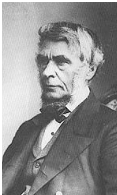
El botànic anglès Georges Bentham.

George Bentham era un botànic anglès establert a Montpeller, on va residir amb la seva família [7]. Bentham es va proposar fer