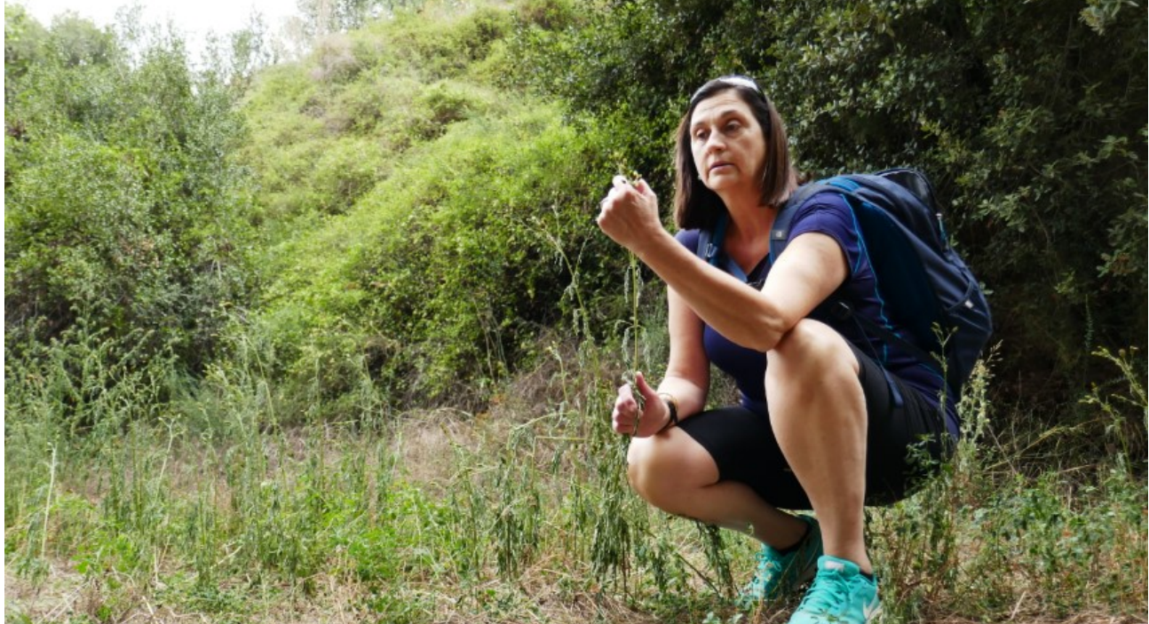
Treball de camp.

exemple, pel que fa referència tant al menjar com als medicaments, molta gent pensa que es podria viure sense consumir productes tan manipulats artificialment. Crec que, en aquest aspecte, es fan actuacions, però bàsicament són de caire individual; no veig que es facin gaires polítiques sobre aquest tema. Les polítiques a les quals em refereixo passarien per l'educació, sobretot en medis urbans. Si des de petits no hi ha una educació per a fomentar aquest contacte amb la natura i l'ús dels recursos naturals que tenim a l'abast, la gent que viu enmig de l'asfalt no l'acaba coneixent. Aquesta educació hauria de ser a tots els nivells, tant des dels centres educatius com des de les famílies.