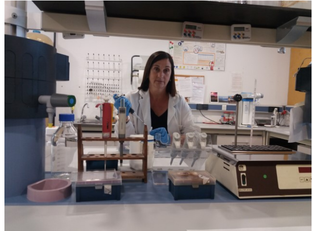
Un dels laboratoris de l'IBB.

Jo crec que aquí passarà com a França. Allí van anar eliminant les assignatures de botànica de totes les disciplines acadèmiques, fins al punt que ara no tenen científics preparats que puguin reconèixer els organismes vegetals i, conseqüentment, es veuen obligats a anar-los a buscar a l'estranger. El problema és que difícilment conservarem o conscienciarrem si no coneixem els organismes. No se li dona cap prioritat, actualment, a aquest tipus de coneixement, i el problema el tenim també dins el sistema científicoacadèmic, perquè si tu tens un estudiant i li dius que treballi en flora, l'estàs sentenciant directament, perquè no