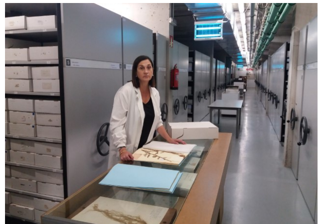
Herbari de l'IBB.

Respecte això, ara diré quelcom que potser no serà del grat de tothom, però és el que penso. Considero que el problema de fons és que les persones esperem que l'administració ens solucioni els problemes. I és cert que l'administració pot fer algunes accions, però la societat està formada per individus i cada individu, primerament, hauria d'assumir la seva pròpia responsabilitat, i jo crec que aquí les dones no hem assumit suficientment la responsabilitat que ens pertoca. No n'hi ha prou de manifestar-se el dia 8 de març, si les tasques de casa no es distribueixen a parts iguals. Si les dones arribem a casa i ens cuidem dels nens, només nosaltres fem festa quan estan malalts, o el pare va amb bicicleta mentre nosaltres fem el sopar, per posar alguns petits exemples quotidians, això, per molt que ens manifestem, l'administració no ens ho solucionarà i els nostres currículums se'n ressentiran. Només cal fer-se una pregunta: quantes dones se'n van de post-doc i deixen el marit amb les criatures? I a l'inrevés? Crec que la resposta a aquesta pregunta evidencia clarament el problema. Així doncs, és realment que