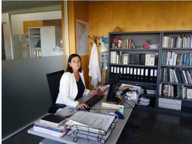
Despatx de direcció de l'IBB.

bastant perquè no el faig servir gaire. I per últim, he anat aprenent anglès. Però l'anglès és una llengua que a mi em va arribar tard i, tot i que la parlo i l'escriu a diari, no l'he arribat a dominar pas tant com el francès. I amb aquests cinc idiomes vaig tirant i sortint-me'n una mica com puc.