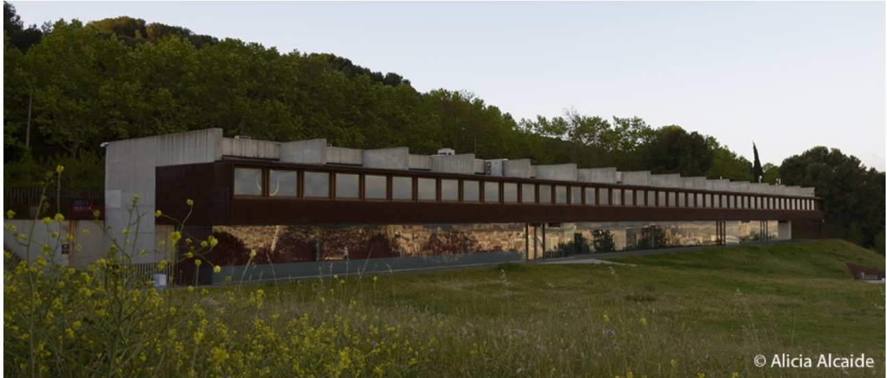
Edifici de l'IBB.