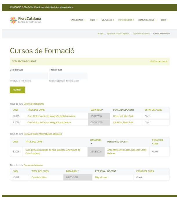
Fig 2. Cercador de cursos de floracatalana.cat.

Així doncs, gràcies a ells, tota aquella teranyina de funcionalitats i requeriments establerta a l'anàlisi es va anar concretant, a mesura que es programava la plataforma, en la següent estructura de menús: