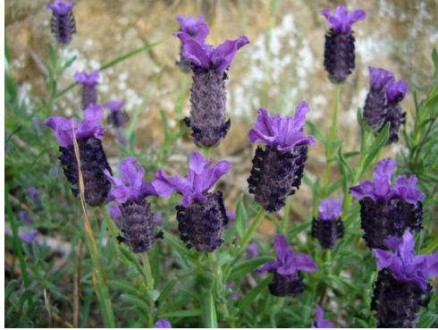
El cap d'ase és també una lavanda.