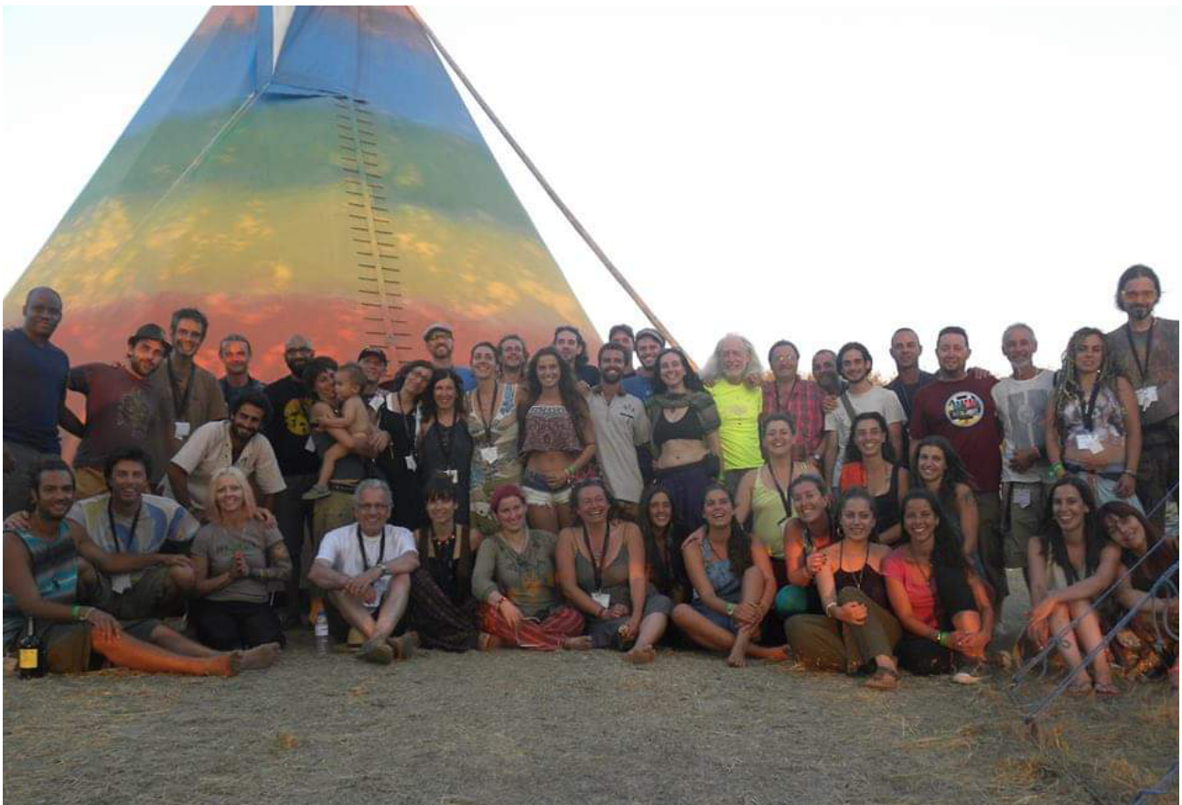
Figura 3. Equip assistencial Kosmicare, Boom Festival 2014 [Iker Puente]

d'al·lucinògens entre els asteques, que s'acabaria convertint en la meua primera publicació, dins de Medicina e Historia . L'any 1971, a partir de la meua primera experiència amb LSD -a peak experience -, el meu entusiasme va anar en augment, lamentant que la psiquiatria acadèmica no podia seguir una recerca que s'albirava tan prometedora. L'any 1977, en el decurs d'un viatge per Mèxic, vaig poder visitar Huautla de Jiménez, experimentant per primera vegada l'efecte dels "honguitos", bolets psicodèlics en plena Sierra Mazateca. Una altra experiència reveladora, realment inefable; resulta impossible descriure amb paraules el conjunt de sensacions, emocions i pensaments que, amb el guiatge pertinent, poden esdevenir una experiència transformadora, curativa, mística o també –tot s'ha de dir-, transformar-se en un episodi angoixant, allò que en argot s'anomena un "mal viatge". Aquests processos quasi psicòtics que sobrevenen a una minoria d'usuaris, poden ésser reconduïts, esdevenint vivències d'autoconeixement. La meua experiència reiterada com a psiquiatre voluntari dins d'un equip d'atenció ad hoc -com és el projecte Kosmicare-, en el marc d'un macrofestival musical caracteritzat per